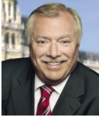
Bürgermeister Dr. Michael Häupl